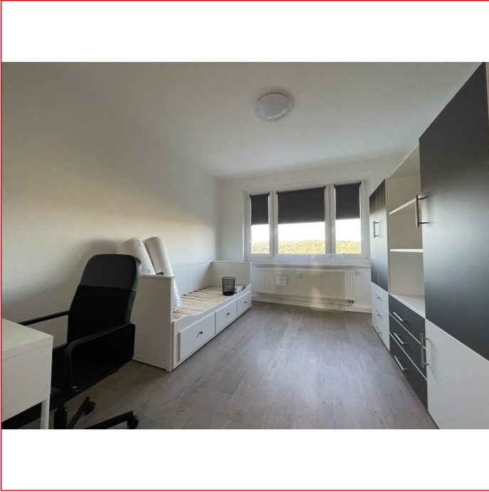
Musterfoto Zimmer 2